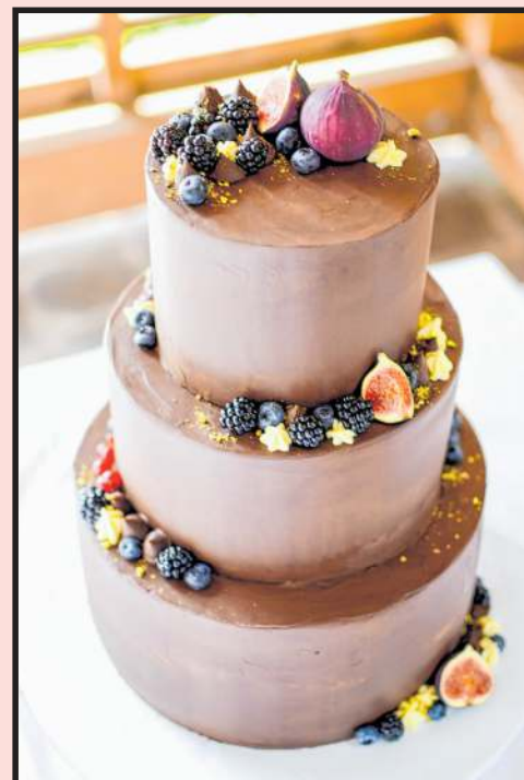
Azok a finom részletek...

időmben lovagolni járjak és nyelveket tanuljak. Azt hiszem, az álmodozással, tervezéssel sosem volt gondom, viszont a megvalósítás az már egy nehezebb dolog. Igyekszem mindig aktív és tartalmas életet élni, töreksem a maximalizmusra és így elérni az álmaimat.