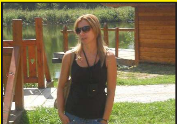
Tavaszi nagytakarítás: pipa

– Nálam is minden évben sor kerül a tavaszi nagytakarításra. Ilyenkor az egész házat tetőtől padlógig megszabadítom a portól. Természetesen az ablakokat is lemosom, és a függönyök is bekerülnek a mosógépbe. Mivel a házunkhoz egy kis kert is tartozik, tavasszal ott is vannak halaszthatatlan tennivalók. Minden évben ültetek ezt-azt, úgyhogy az agyásokat ki kell alakítani, és kapálni, gyomlálni is kell.