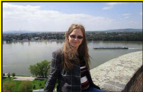
Már nagyon várták a jó időt

– Tavasszal, mint sok helyen, nálunk is a kert munkálatok kerülnek előtérbe. A tavalyi, elszáradt leveleket el kell tüntetni, csakúgy mint a letört ágakat és gallyakat. Persze a munka mellett az évszak magával hozza a kirándulás lehetőségét is. Sokat barangolunk a közeli túraút-vonalakon, és csodáljuk az ébredő természet szépségét.