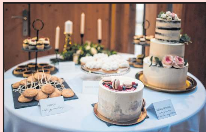
Mindegy, mi az alkalom, a végeredmény kívül-belül mesés