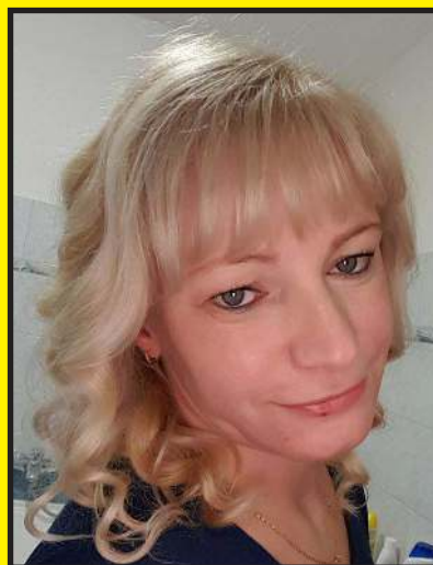
Bizony, a kerttel sok munka jár

– Nálunk a tavasz a sok-sok munkát hozza magával. Van egy nagyobb szőlőnk, ebben minden évben elengedhetetlen a metszés. Idén hárman csináltuk három teljes napon keresztül. Aztán ott van a sziklakertem, amelybe minden évben szeretek egy kis változtatást becsempészni. Most az évelő növények ültetését tűztem ki magam elé. Mivel akkora kerttel rendelkezünk, hogy helyünk bőven akad, most három gyümölcs-fával is szeretnénk gazdagítani a növényállományunkat.