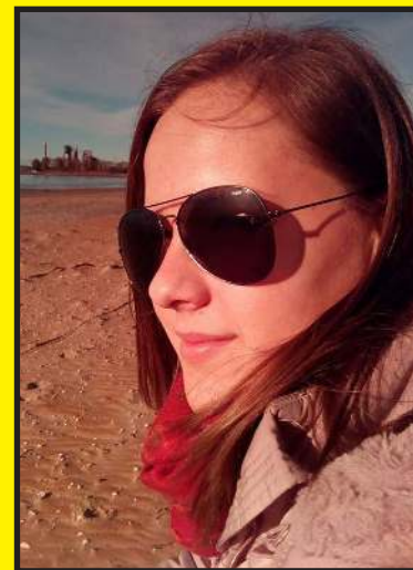
Ez a tavasz más, mint a többi

– Idén a tavasz igencsak sűrűre sikeredett. Energiáim egy részét a munka köti le, hiszen pedagógusként nem-sokára eljön a minősítem ideje. Ez rengeteg felkészüléssel és még több papírmunkával jár. A magán-életem is fordulópontjához érkezett, hiszen májusban férjhez megyek. Természe-tesen az esküvő megszerve-zése nem kis feladat, így a szabadidőm gyakorlatilag mind erre megy.